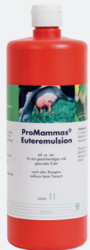
1000 ml Flasche

Die Haut jedes Euterviertels zweimal täglich nach dem Melken mit 2–3 ml der Pflegeemulsion einreiben. Die Anwendung direkt vor dem Melken kann zur geruchlichen Beeinträchtigung der Milch führen.