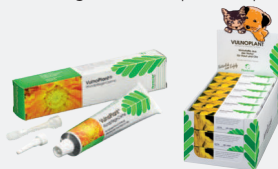
Tubes de 10 g / 45 g avec canule d'application Présentoir avec 18 tubes de 10 g

Crème de soins à base de miel avec le complexe végétal composé de camomille, de calendula et d'hamamélis, auquel de l'huile de foie de morue aux propriétés régénérantes pour la peau a été ajoutée