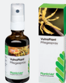
Flacon pulvérisateur de 50 ml

Solution pour pulvérisation sur les plaies destinée à favoriser la régénération cutanée, à base d'extraits de calendula, d'hamamélis et de sauge, ainsi que de dexpanthénol et d'huile de thym